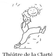
Théâtre de la Clarté